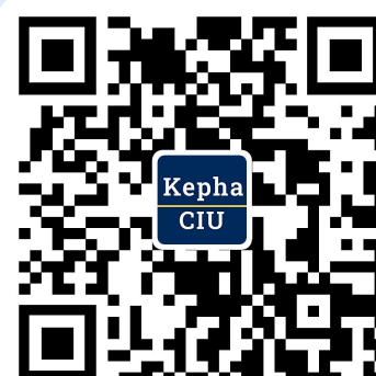
订阅精华讲座等 资讯