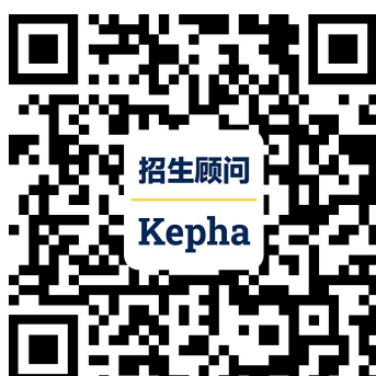
招生顾问 (微信号: kepha1)