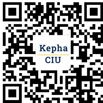
微信订阅号 (CIU Kepha学苑)