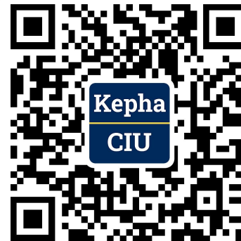
微信服务号 (CIU Kepha学院)