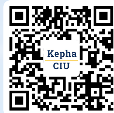
微信订阅号 (CIU Kepha学苑)