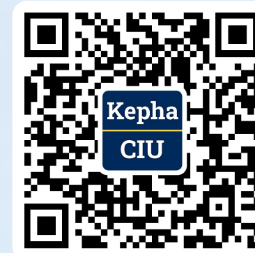
微信服务号 (CIU Kepha学院)