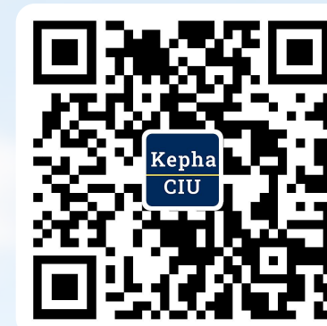
订阅精华讲座等 资讯