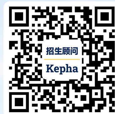
招生顾问 (微信号: kepha1)