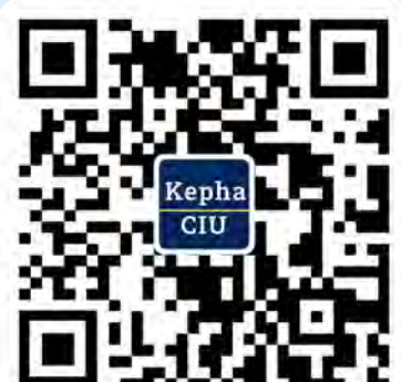
订阅精华讲座等 资讯