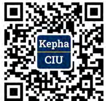
微信服务号 (CIU Kepha学院)