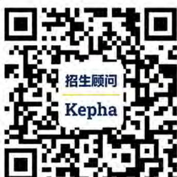
招生顾问 (微信号: kepha1)